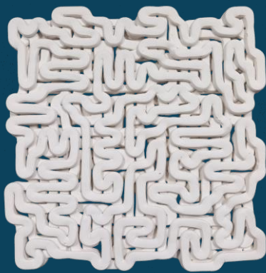
L x A: 21x21 cm

Permite, ainda, o fabrico de peças de design único e complexo, impossível de obter por outras técnicas já existentes, nomeadamente o uso de moldes. Este último desenvolvimento coloca, uma vez mais, a Sival na vanguarda do setor onde atua, demonstrando a sua capacidade de inovação e visão de futuro.